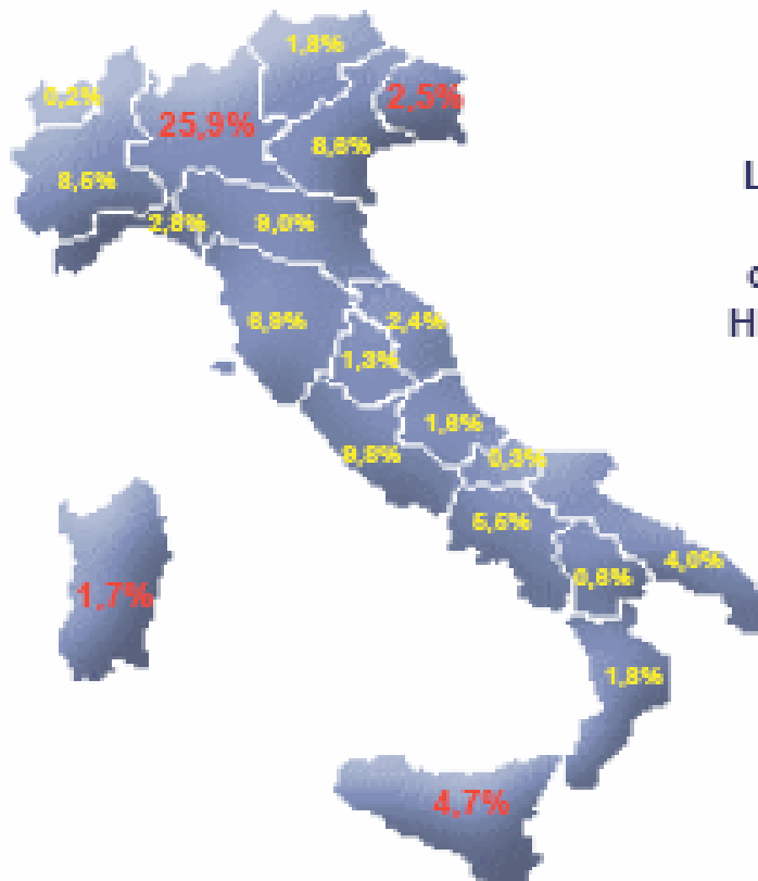
Distribuzione ricchezza HNWI

Lombardia e Friuli evidenziano una concentrazione di HNWI relativamente superiore al PIL...Sardegna e Sicilia sono sul fronte opposto